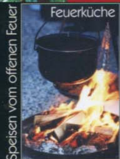
Speisen vom offenen Feuer

in Zusammenarbeit mit dem Kulturkreis Gronau e.V. www.kukt-projekt.de oder www.kulturkreisgronau.de