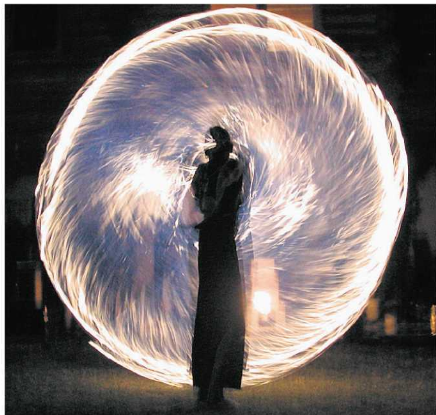
Feuer und Liebe: Die Auen-Nacht in Deilmissen verspricht viele Höhepunkte. Sie findet statt am kommenden Samstag, 19. September. Zeit genug, sich vielleicht ja auch noch eine schöne Verkleidung auszudenken.

Der Einlass zur Auen-Nacht am kommenden Samstag, 19. September, in Deilmissen ist um 18 Uhr, Beginn der Veranstaltungen um 19 Uhr.