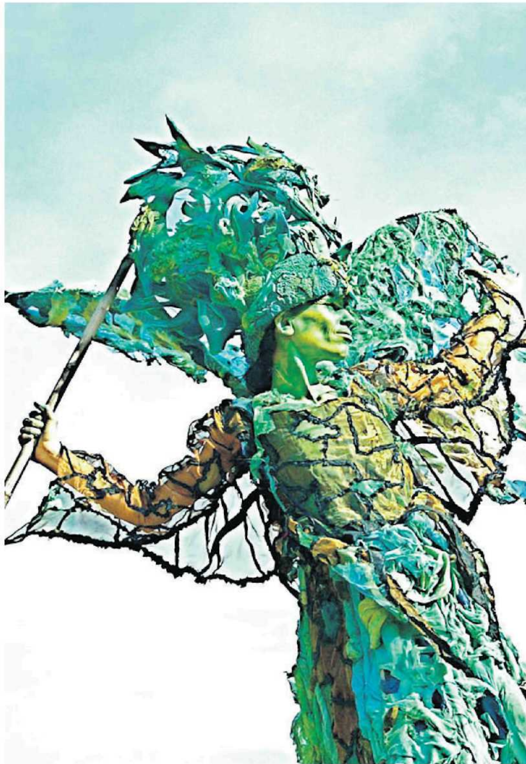
Wie ein Wesen aus einer anderen Welt: Deilmissen lädt für den kommenden Samstag zur ersten „Auen-Nacht“ in einen Traumgarten ein.

Für Jung und Alt ist bei diesem Fest im Deilmisser